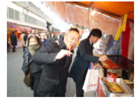
5.でも200円で美味しかったからいいですけど