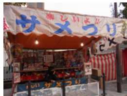
18.サメ釣り屋さんには人気が無いですね！