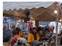
14.おばさんに「そのお姉さんまけとくよ」って言っていました