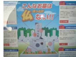
24.こんな看板を見つけました