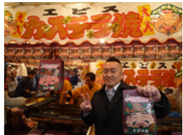
21.これは縁起がいいから買いました