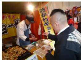
16.私はまだお腹が空いているんです