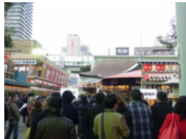
27.ようやく今宮戎神社に到着しました