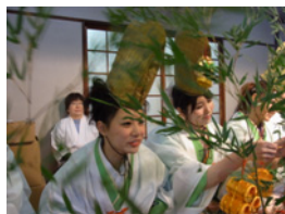
32.縁起物の数々を付けてもらいました