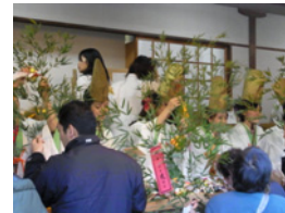
29.そして笹をいただいて