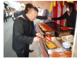
4.やる気のなさそうなお姉さんでした