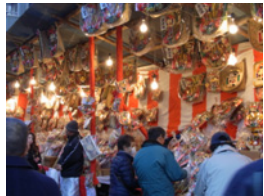
26.いやー縁起が良さそうですね