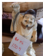
12.ホンマに象牙？？150万円って！