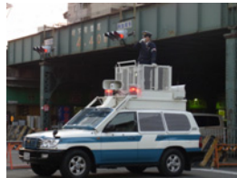
23.大阪府警の皆様ご苦労さまです