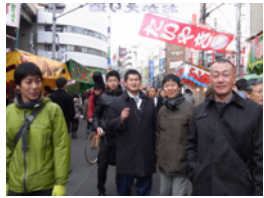
1.電車に乗って難波までやってきました