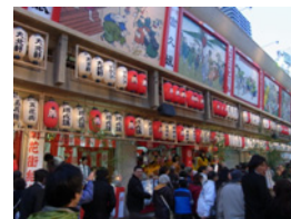
34.今年は辰年ですので飛翔の年にしたいものです