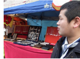
9.浪花の小栗旬の横顔です