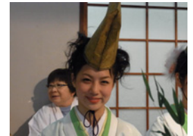
30.審議の結果、この福娘さんに決めました