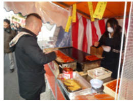
3.だからフランクフルトを買いました