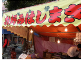
6.お好みはしまき屋さんです