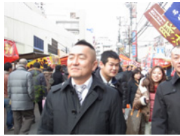
2.私はお昼ご飯食べてないんでお腹が空いています