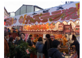
20.えべっさんのカステラ焼きです