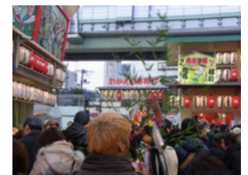
35.今年の勝和技研も頑張りますのでよろしくお願ひします