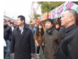
19.左から小栗旬、反町隆、渡辺謙！浪花の。