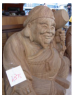
11.花咲翁さんかな？！18万円也