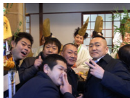
33.全員で縁起がいいポーズで記念撮影しました