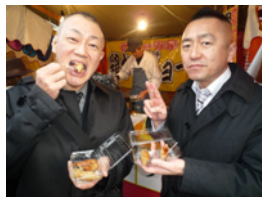
17.渡辺謙と鶏かわぎョーザを食べました