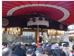
28.営業職全員で商売繁盛祈願しました