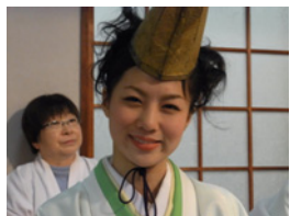
31.後ろのおばさまではありません