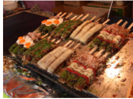
7.とても美味しそうだったので